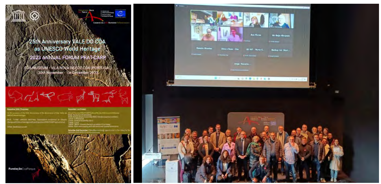
Cartel y foto de familia de la Asamblea general celebrada en el Museu do Côa en 2023

Finally, we welcome the arrival of the tenth country on our Cultural Route, Croatia, thanks to the incorporation of the Archaeological Museum of Istria (Pula), manager of the Romualdova Cave.